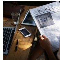
Wirtschaftsnachrichten (Symbolbild).